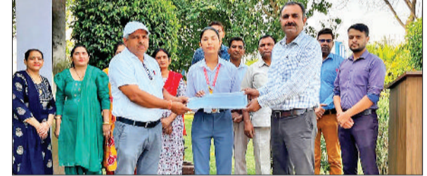
चरखी दादरी। परीक्षा में सफलता प्राप्त करने वाले विद्यार्थियों को सम्मानित करते अतिथि।

मामले में किसी तरह की कोई हिलाई व कोताही नहीं होनी चाहिए। अगर किसी ने हिलाई व कोताही बरती तो उनके खिलाफ कार्रवाई की जाएगी। यहां यह बताते चले कि विगत में शिक्षा विभाग ने दो किलोमीटर की दूरी से ज्यादा आने वाले विद्यार्थियों को स्कूल में लाने व ले जाने के लिए यातायात की व्यवस्था की जाने के निर्देश दिए थे। ताकि दूर दराज से आने वाले बच्चों को स्कूल में पहुंचने में कोई परेशानी न हो जाए। निर्देशों के बावजूद कितने स्कूल मुखियाओं ने यातायात की व्यवस्था करके बच्चों को लाने व ले जाने के लिए वाहन की व्यवस्था की है। उक्त रिपोर्ट तत्काल भेजे जाने के आदेश दिए हैं।