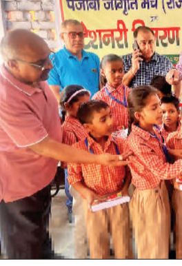
भिवानी। जरूरतमंद छात्रों को स्टेशनरी वितरित करते पंजाबी जागृति मंच पदाधिकारी।