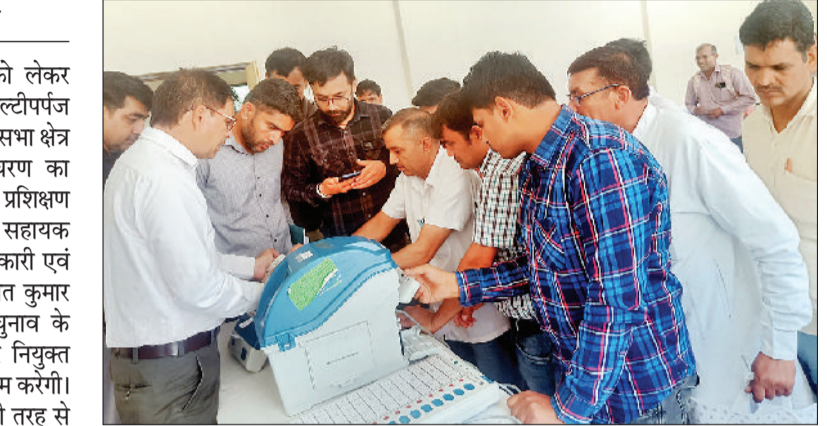
लोहारू। प्रशिक्षण के दौरान ईवीएम की जानकारी हासिल करती चुनाव से जुड़े अधिकारी व कर्मचारी।