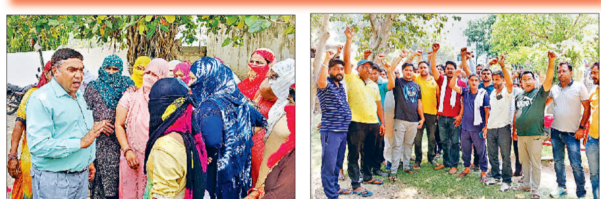
भिवाणी। पानी की सप्लाई की मांग को लेकर महिलाओं को आशवासन देते अधिकारी और जिला प्रशासन के खिलाफ नारेबाजी करते आर ओ प्लांट संचालक।

जिला प्रशासन के आशवासन पर प्रदर्शनकारियों ने खोला रास्ता