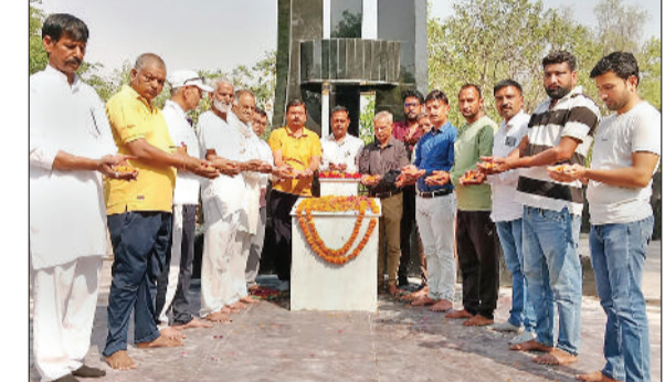
भिवानी। शहीद स्मारक पर पुष्पांजलि अर्पित कर शहीद सुखदेव सिंह को श्रद्धांजलि देते गणमान्य लोग।

उन्होंने बताया कि सुखदेव सिंह का जन्म 15 मई 1907 को पंजाब के जालंधर जिले के नांगल तालाब गांव में हुआ था। उन्होंने बताया कि सुखदेव की जोड़ी भगत सिंह के साथ बहुत सशहूर है। दोनों ने ब्रिटिश शासन के खिलाफ स्वतंत्रता संग्राम में भाग लिया था। उन्होंने कहा कि शहीद सुखदेव सिंह, भारतीय स्वतंत्रता संग्राम के महान स्वतंत्रता सेनानी थे। उनका