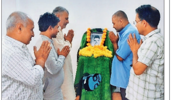
भिवानी। शहीद सुखदेव सिंह को नमन करते शहीद भगतसिंह ब्रिगेड के सदस्य।

जन्म 15 मई 1907 को हुआ था। उन्होंने भगत सिंह व राजगुरु के साथ मिलकर हिंदुस्तान सोशलिस्ट रिपब्लिकन एसोसिएशन की स्थापना की, जो ब्रिटिश शासन के खिलाफ आंदोलन की नींव थी। इस